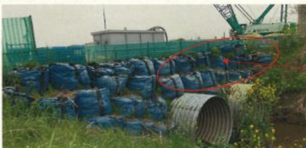
当日に排水管の撤去を指示

当該箇所の濁水処理タンクについては、指摘を受けてすぐに新川への放水管を撤去し、濁水が流出しないよう物理的な対応を実施