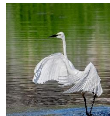
ワルツを披露する ダイサギ

ホームページ： https://www.facebook.com/Kiyonori.Ookura